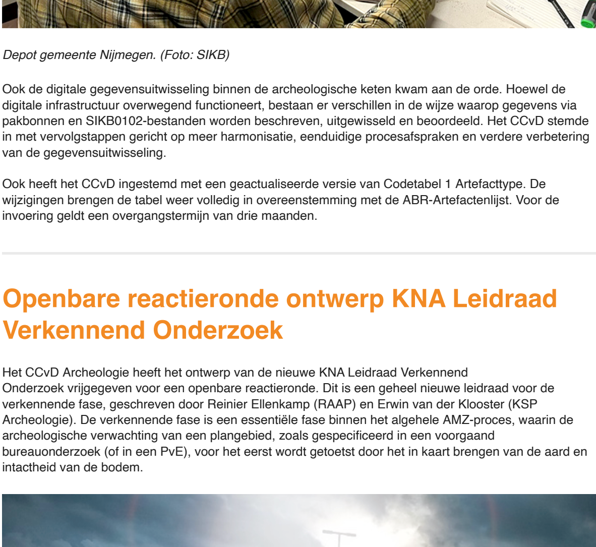
Depot gemeente Nijmegen.

Deponeren was een belangrijk thema tijdens de vergadering van het CCvD Archeologie in juni 2026. Zo werd het CCvD bijgepraat over de aanbevelingen van de Werkgroep Deponeringstraject van de Rijksdienst voor het Cultureel Erfgoed voor verbeteringen die in de KNA moeten worden verankerd. De voorstellen richten zich op betere en eenduidige afspraken rond deponering en aanlevering van archeologisch materiaal, met aandacht voor PvE's, conservering en selectie van vondsten uit de WOII. De voorstellen voor de standaardeisen deponeren worden naar verwachting in september ter besluitvorming voorgelegd.